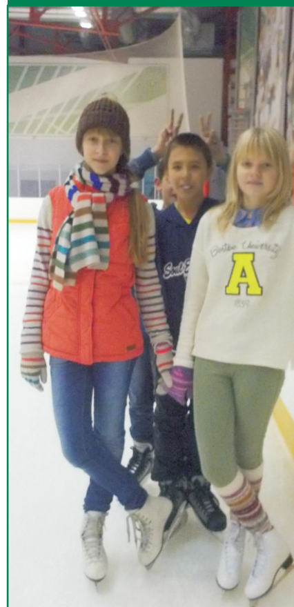
Ученики 7 «В» класса любят кататься на коньках